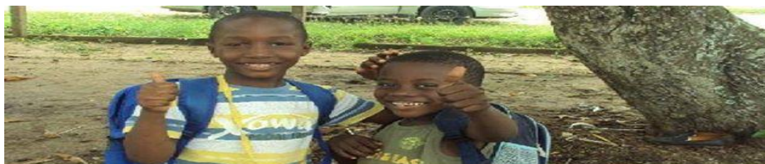
Stichting Toppie! Voor kinderen met een autistische beperking in Suriname

Het belang van Donoren Het werk van Stichting Toppie! kan alléén bestaan dankzij de waardevolle giften van donateurs. Alleen zo kan Stichting Toppie! ervoor zorgen dat zoveel mogelijk kinderen met Autisme in Suriname een kans krijgen om hun eigen toekomst positief te beïnvloeden. Met uw gift is het mogelijk om een coach programma op niveau aan te bieden. Zo kan Stichting Toppie! samen met u kinderen met Autisme een mogelijkheid op goede kansen in de samenleving geven. Dit zal niet alleen de kinderen, maar de gehele omgeving positief beïnvloeden. Samenwerken werkt! Wilt u meer weten hoe u Stichting Toppie! kan helpen haar werk goed te doen dan nodigen wij u uit een kijkje te nemen op onze webpagina: http://www.stichting-toppie.org/donateurs